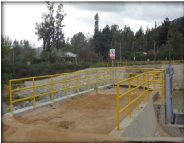
Barandas de protección para obra Bocatoma.

Se instalaron barandas fijas y compuerta en el cajón de alimentación.