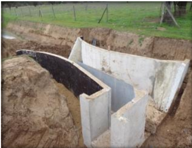
Marco partidor, Tranque Lolol Bajo, Km 7,040.