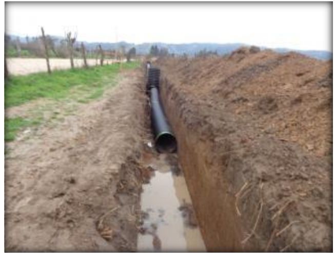
Tubería a Tranque Pastizales, Km 4,800.