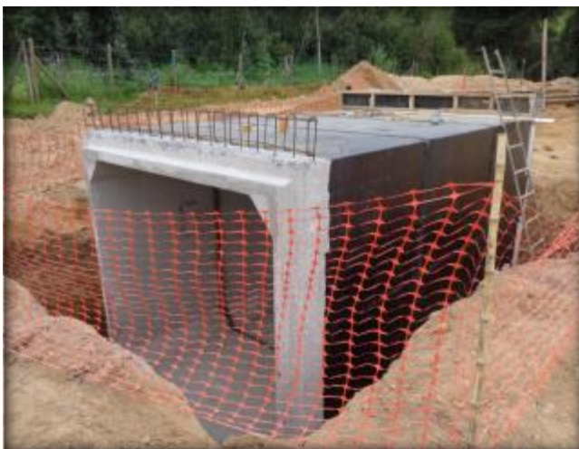
Cajón de paso predial, Km 21,180.