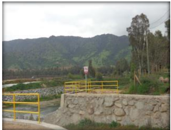
Barandas de protección para obra Bocatoma.