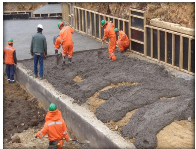
Emplantillado entrada a Sifón Nerquihue, Km 0,000.