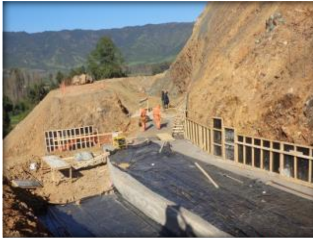
Moldajes y emplantillado de entrada a Sifón Nerquihue, Km 0,000.