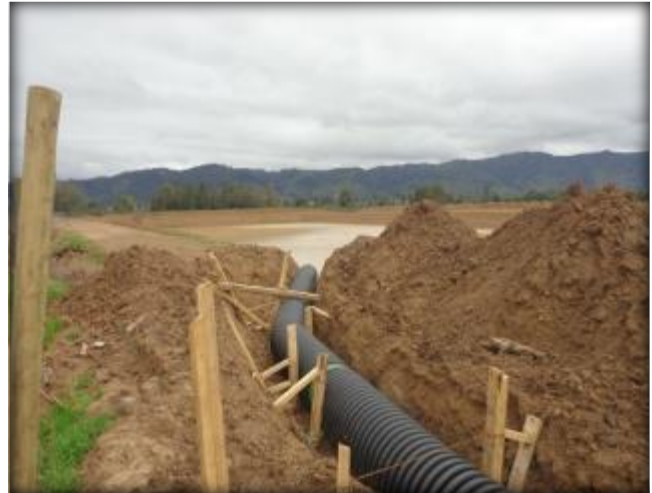
Tubería HDPE de alimentación a tranque.