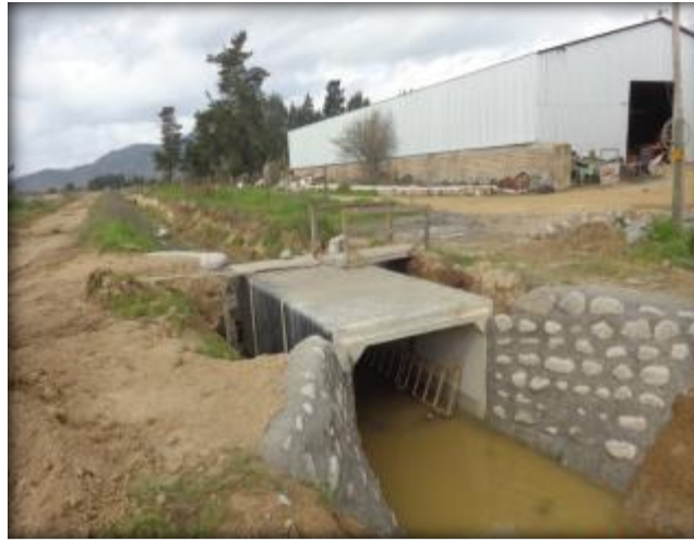
Paso predial, Km 10,720.