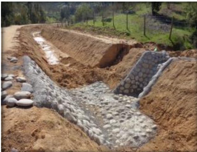
Descarga a canal Tipo 1A, Km 26,070.