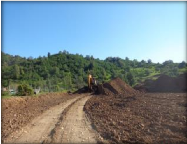
Movimiento de tierras.