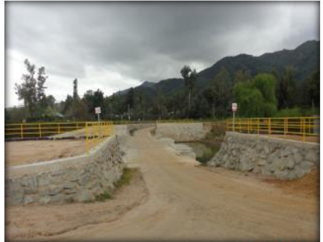
Bocatoma badén, barandas de protección.

Los recursos de este canal permitirán regar los sectores de Pastizales, Lolol Bajo, El Peumo, La Palma, Monterina Baja, Tres Esquinas, Vaticano, Portezuelo y El Guaiquillo.