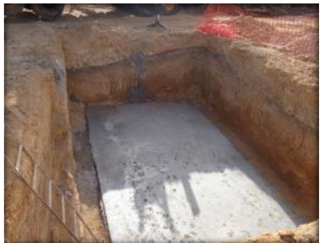
Emplantillado de paso predial, Km 21,580.