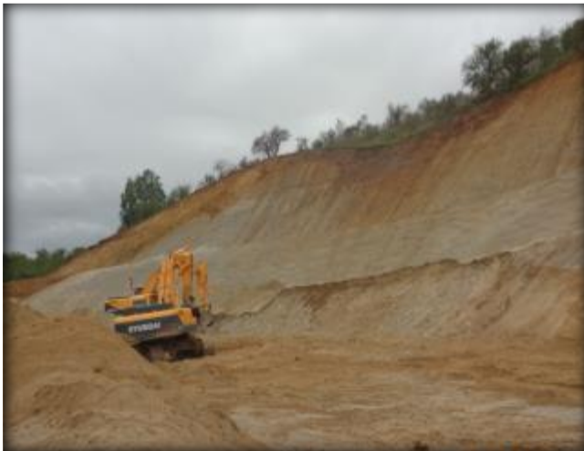
Corte en terreno, Km 37,200.

Movimiento de tierras masivo en sectores puntuales del canal, excepto en cruces de quebradas.