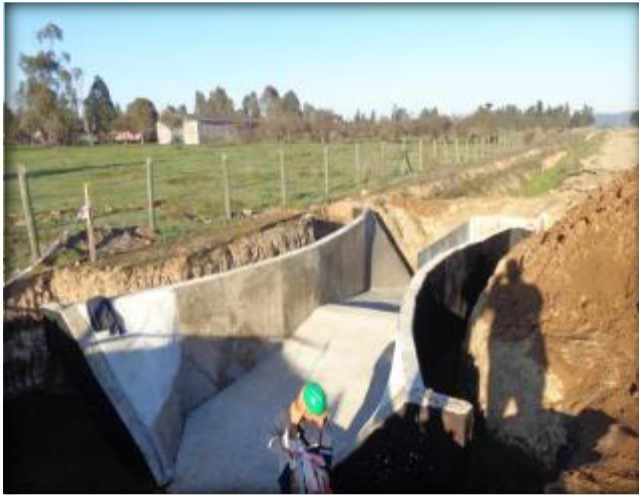
Marco partidor, Tranque El Peumo, Km 9,060.