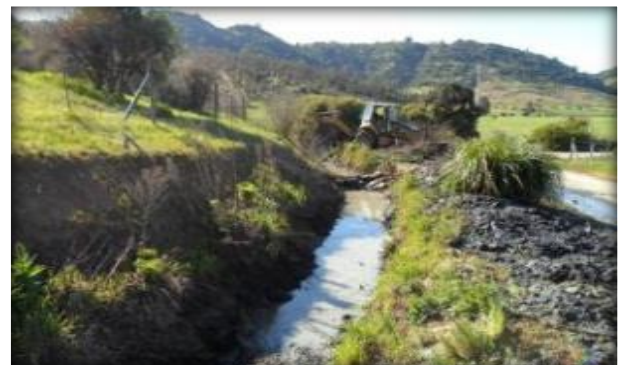
Sector de Canal Panamá Primario.

A partir del Canal Primario, se deriva el Canal Panamá Secundario, que se construirá en esta etapa, con un caudal de diseño establecido en el proyecto de la red primaria de 998 l/s, previsto para regar una superficie de 998 ha, con una longitud de 5.982 m. Será excavado en tierra sin revestimiento.