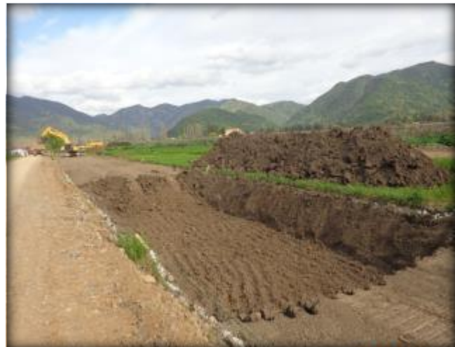
Excavación para Sifón Nerquihue, Km 0,220 al 0,360.