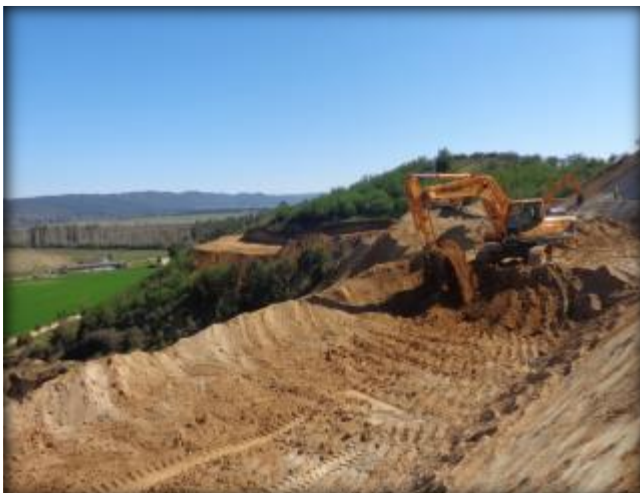
Corte en terreno, Km 37,300.