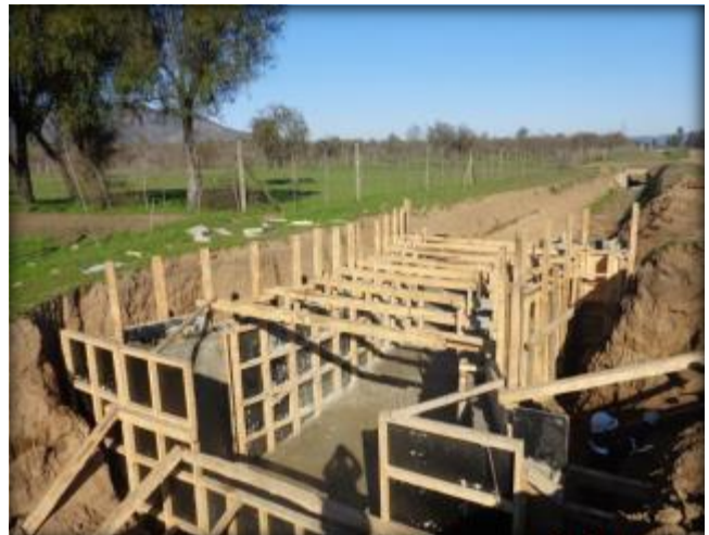
Moldaje para marco partidor, Tranque Lolol Bajo, Km 7,040.