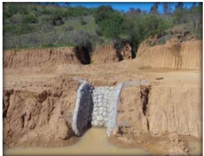
Descarga a canal Tipo 1A, Km 25,990.