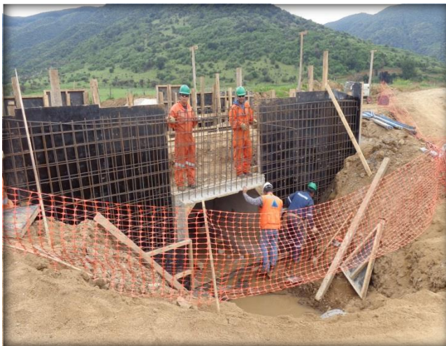
Construcción de cruce de quebrada CQ6, Km 3,760.