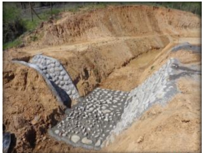
Descarg a canal Tipo 1A, Km 26,270.