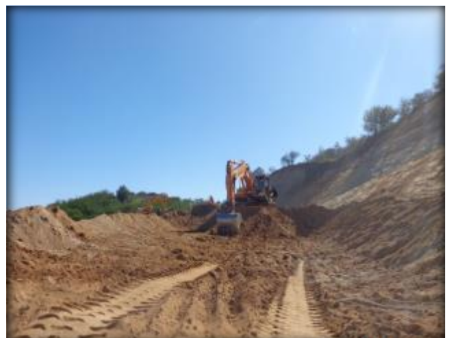
Corte en terreno, Km 37,400.