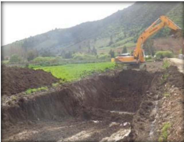
Excavación para Sifón Nerquihue, Km 0,220 al 0,360.