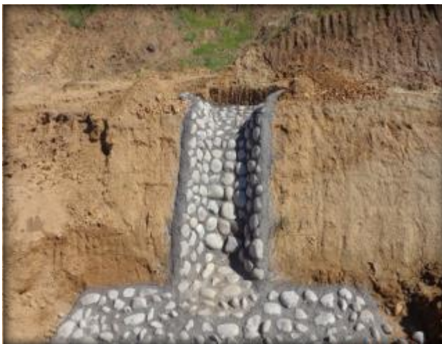
Descarga Tipo 2, Km 25,910.

Construcción de descargas a canal, con mampostería de piedra, en determinados kilómetros.