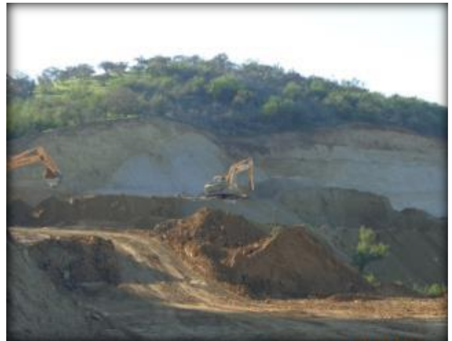
Corte en terreno, Km 37,400.